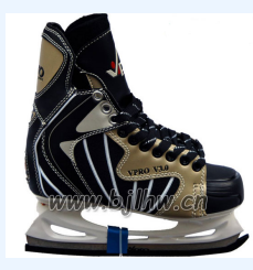
000 VPRO V3.0